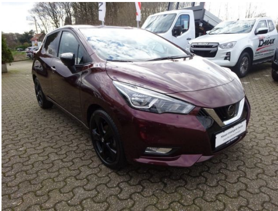
Nissan Micra N-Tec DAB Kamera Sitzheizung